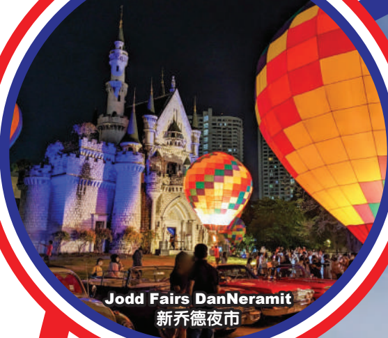
Jodd Fairs DanNeramit 新乔德夜市