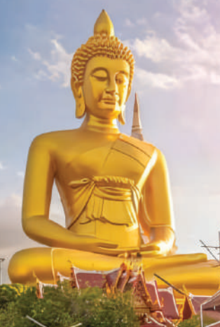
Wat Paknam Bhasicharoen 水门寺大佛

行程次序，以当地旅社安排为准。 Sequences of Itinerary are subject to local arrangement.