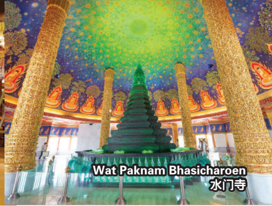
Wat Paknam Bhasicharoen 水门寺