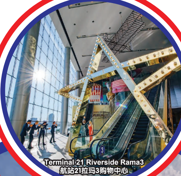
Terminal 21 Riverside Rama3 航站21拉玛3购物中心