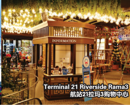
Terminal 21 Riverside Rama3 航站21拉玛3购物中心