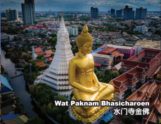
Wat Paknam Bhasicharoen 水门寺金佛