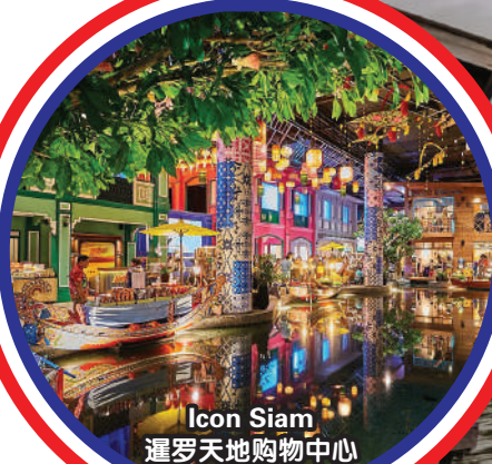
Icon Siam 暹罗天地购物中心