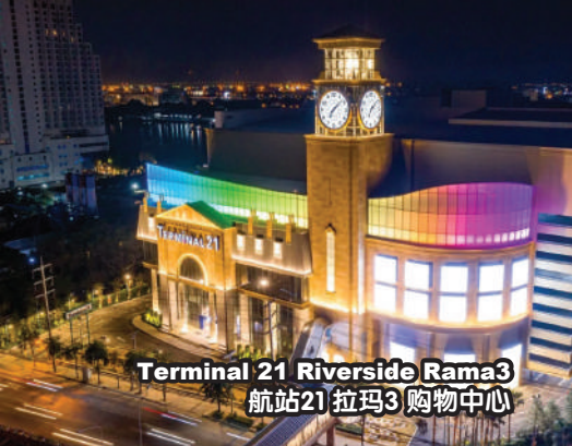
Terminal 21 Riverside Rama 3 航站21拉玛3购物中心