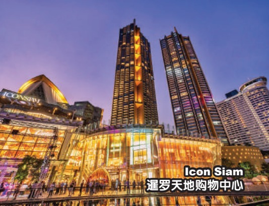
Icon Siam 暹罗天地购物中心