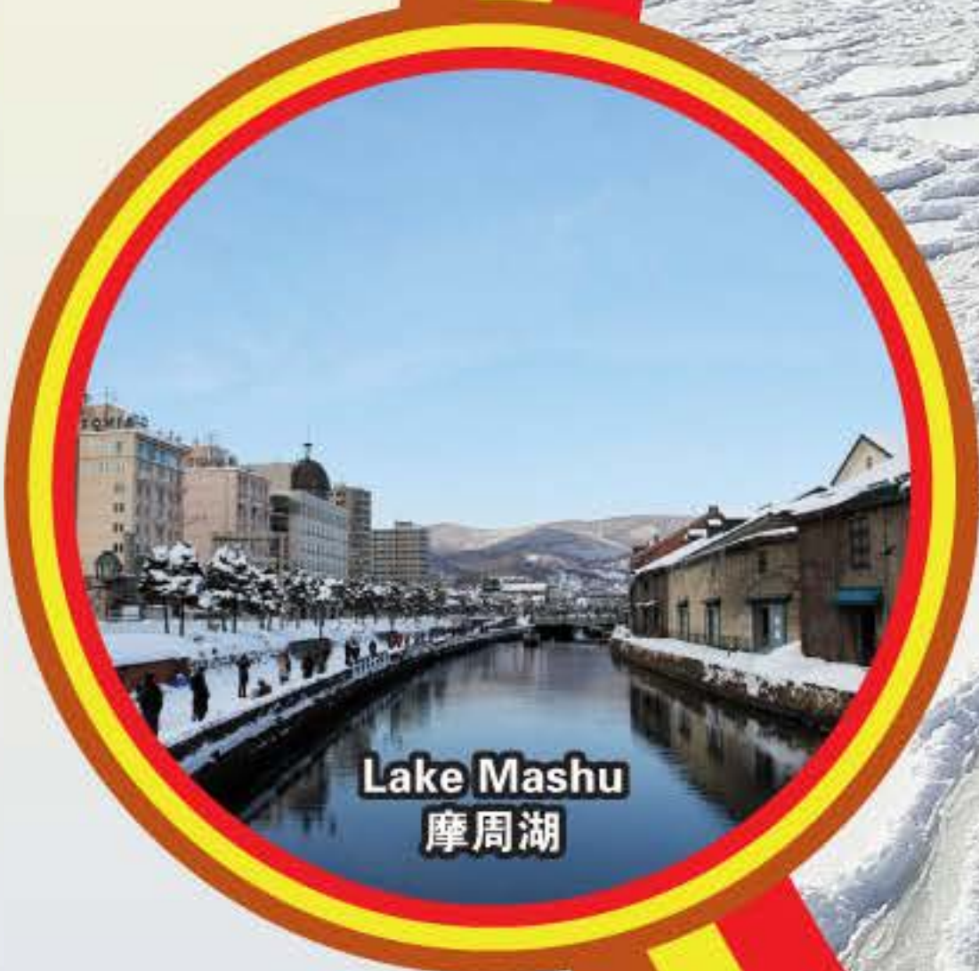
Lake Mashu 摩周湖