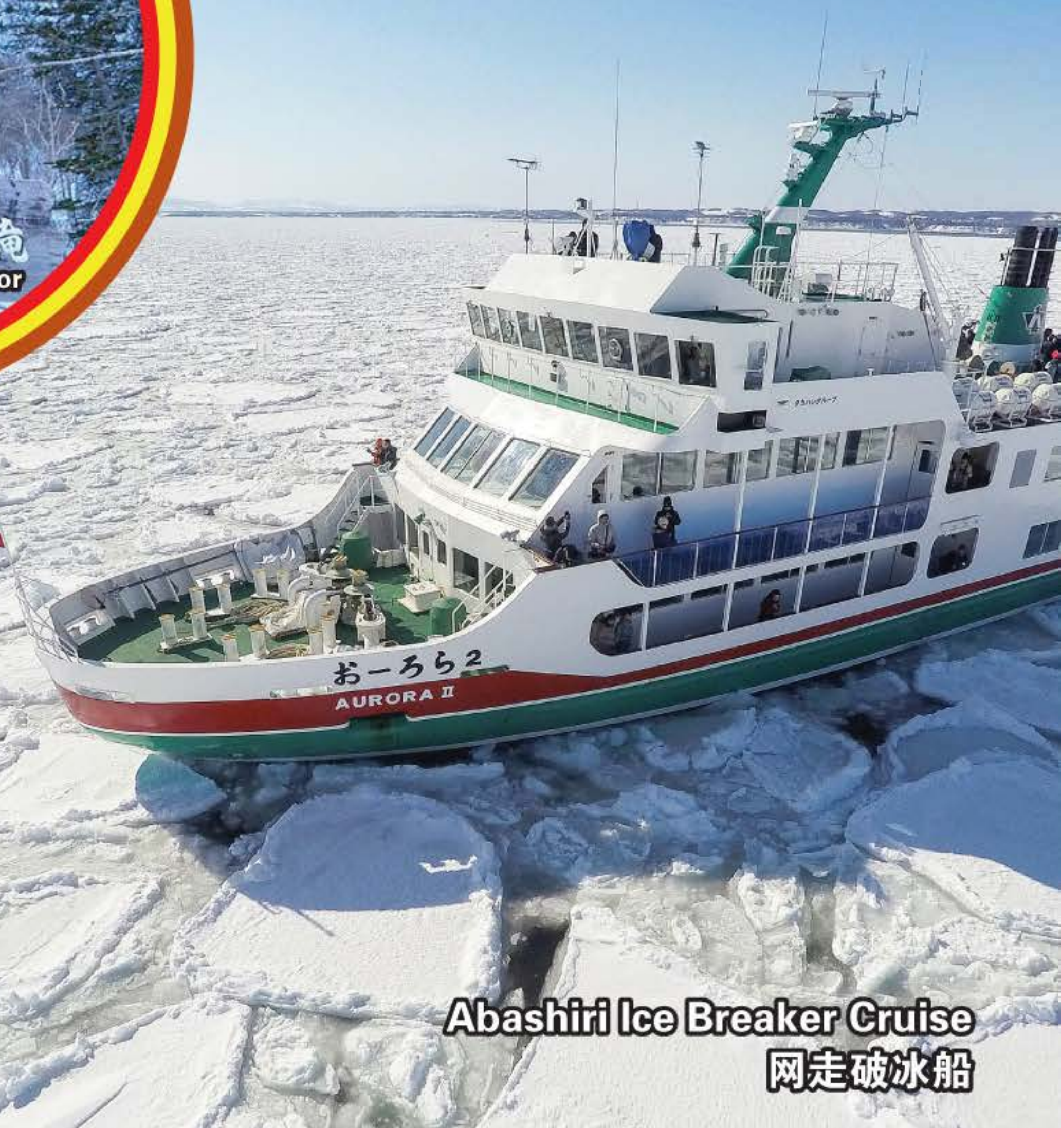
Abashiri Ice Breaker Cruise 网走破冰船

行程次序，以当地旅社安排为准。 Sequences of Itinerary are subject to local arrangement.