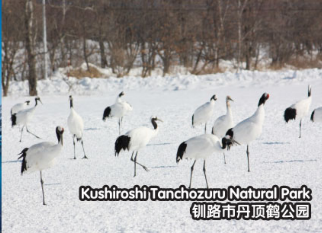
Kushiroshi Tanchozuru Natural Park 钏路市丹顶鹤公园