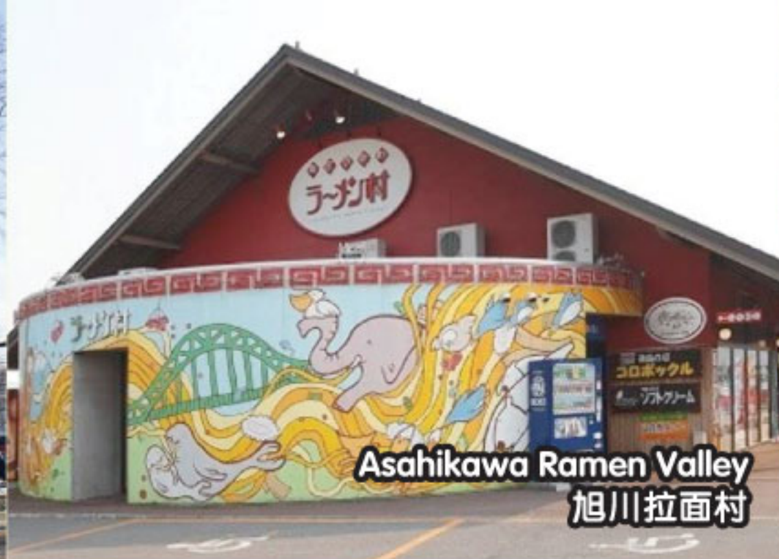
Asahikawa Ramen Valley 旭川拉面村