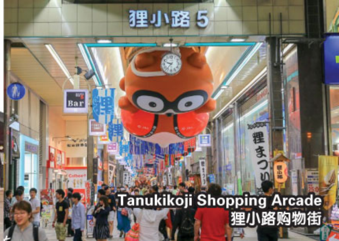
Tanukikoji Shopping Arcade 狸小路购物街