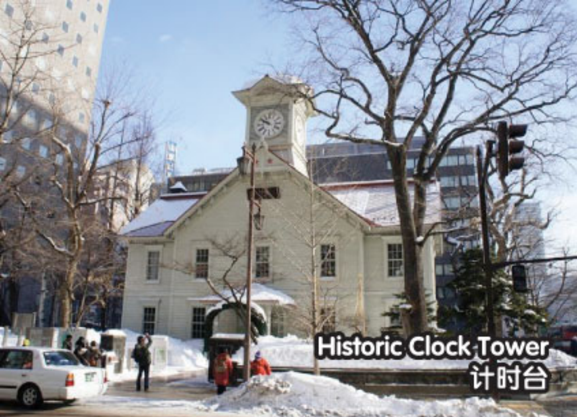
Historic Clock Tower 计时台