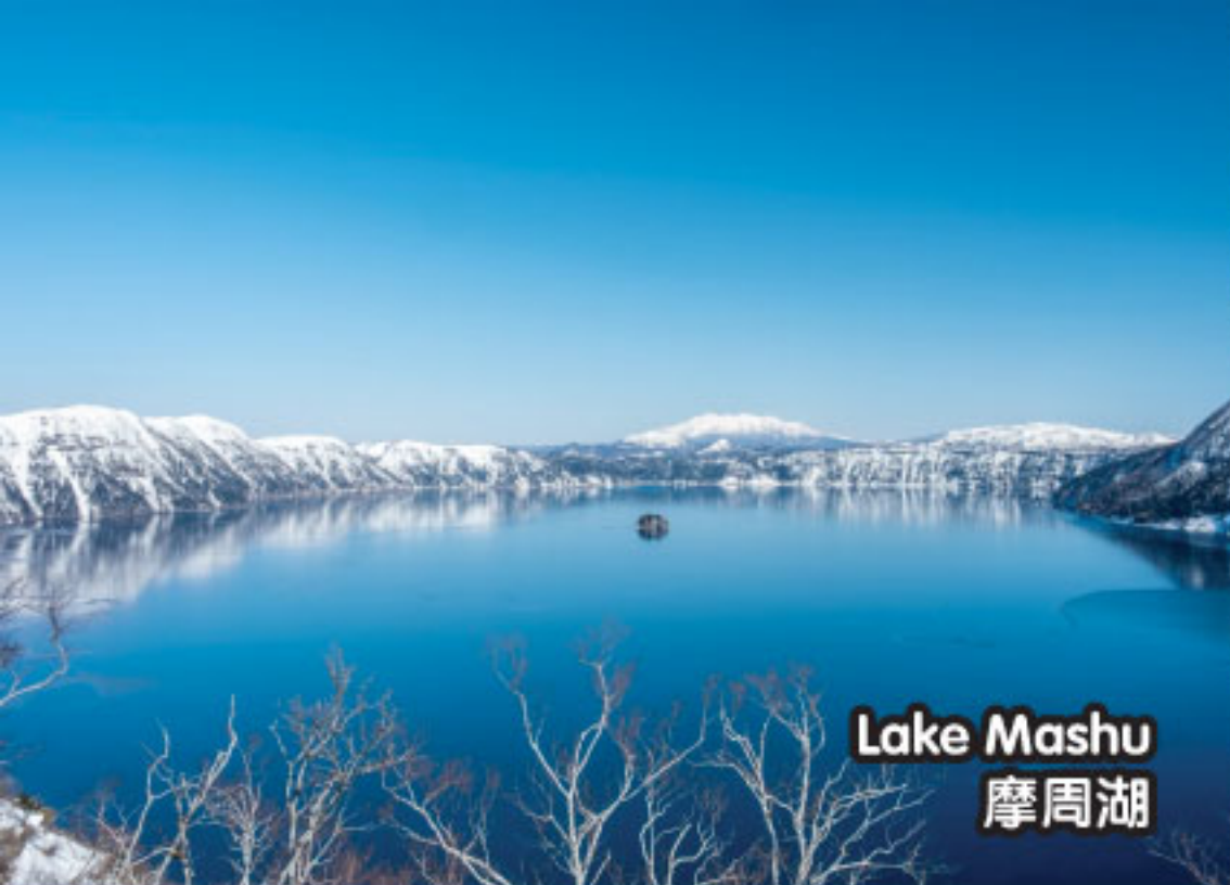
Lake Mashu 摩周湖