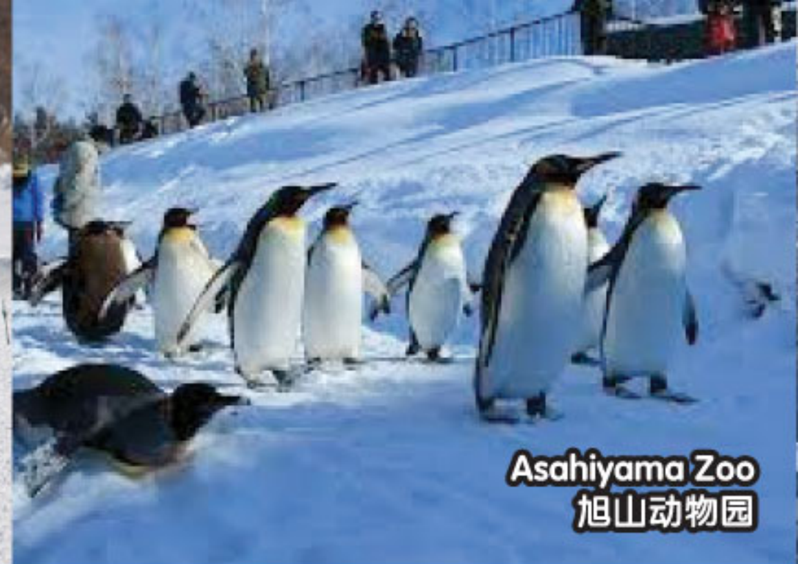
Asahiyama Zoo 旭山动物园